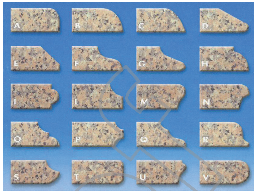
PRINCIPALI PROFILI ESEGUIBILI MAIN PERFORMED EDGES